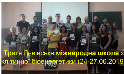
Третя Львівська міжнародна школа з клітинної біоенергетики (24-27.06.2019)